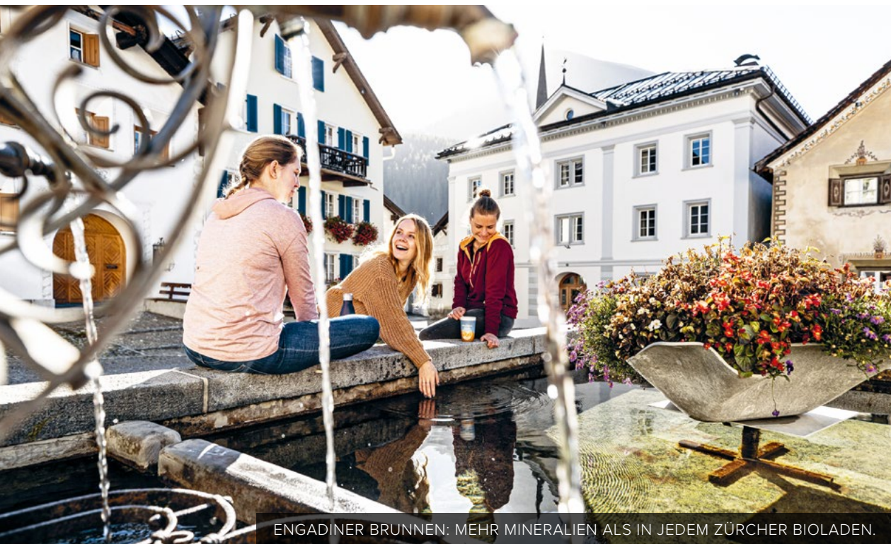
ENGADINER BRUNNEN: MEHR MINERALIEN ALS IN JEDEM ZÜRCHER BIOLADEN.