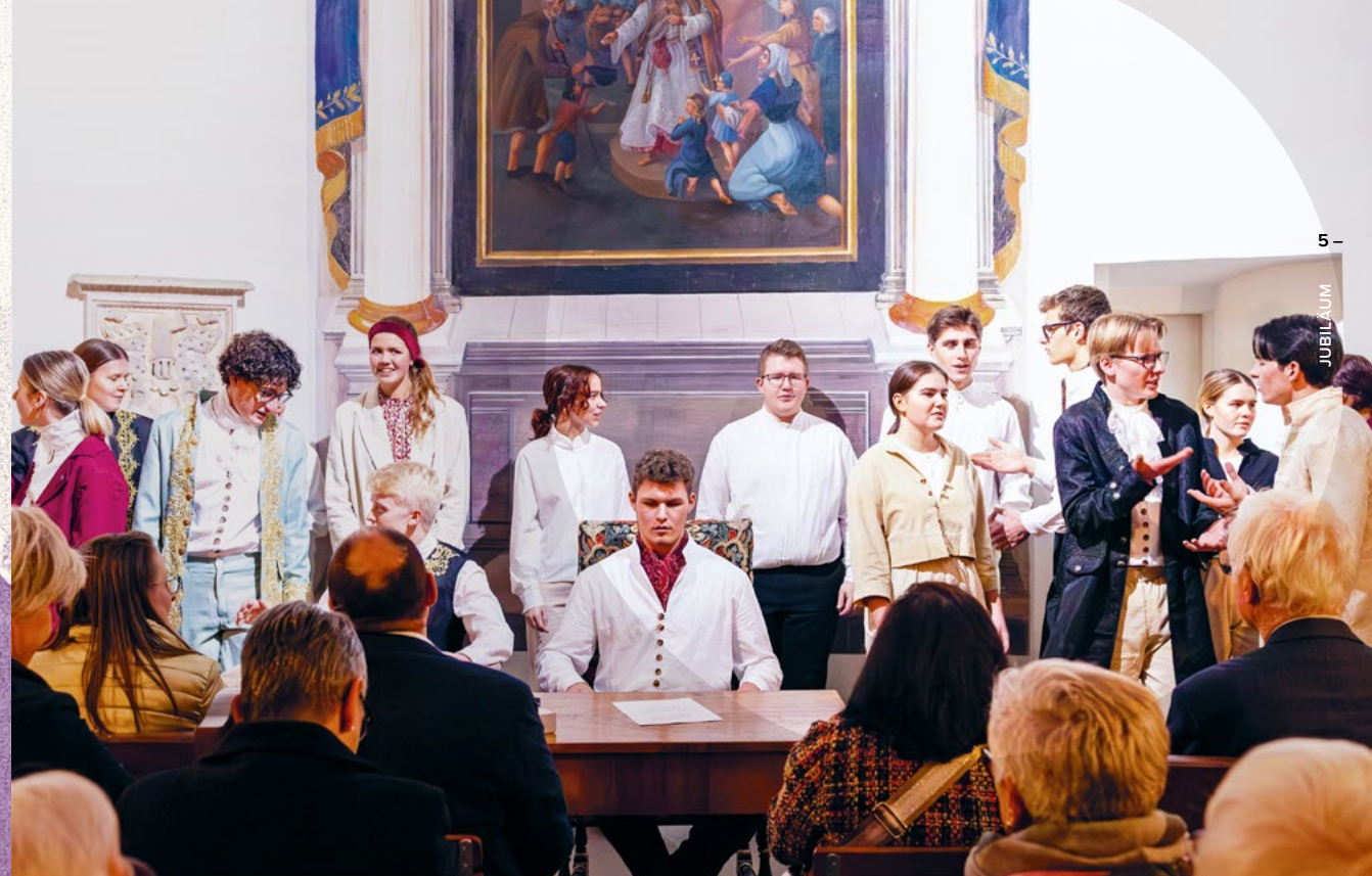
DIE SÄNGERINNEN UND SÄNGER VON INCANTANTI BEI EINER AUFFÜHRUNG